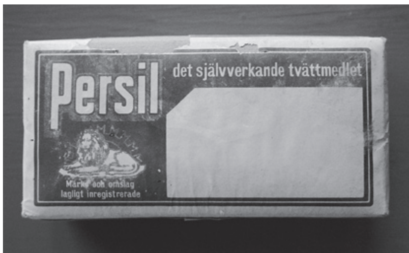
"Det självverkande tvättmedlet".

– Först tände vi eld under en järngryta och värmdde vattnet. Sedan