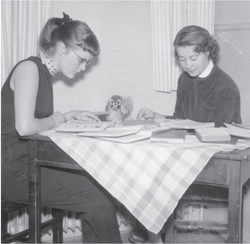
Birgitta Holmbergs privata fotoalbum