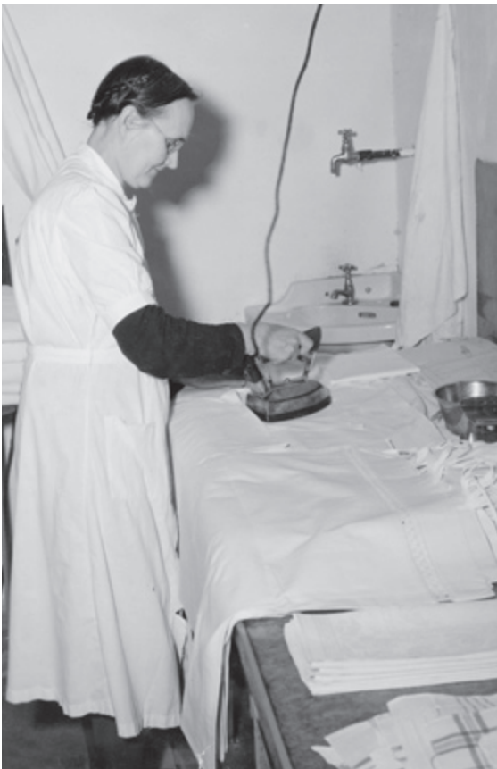
Hägalunds Tvättermuseum i Vårby