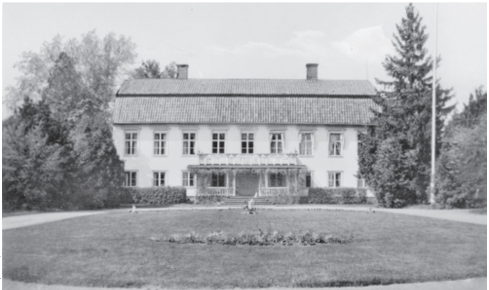
Familjen Släts privata fotoalbum