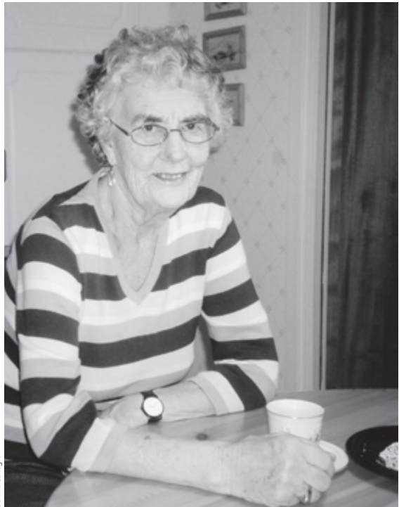
Vid köksbordet 2005.