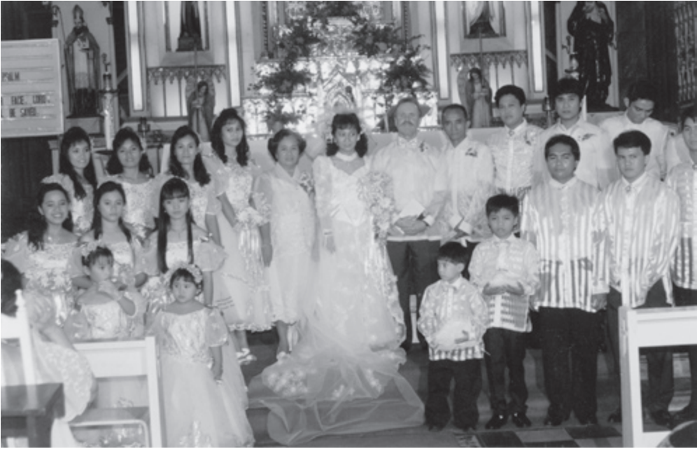
Ditas Enströms privata fotoalbum